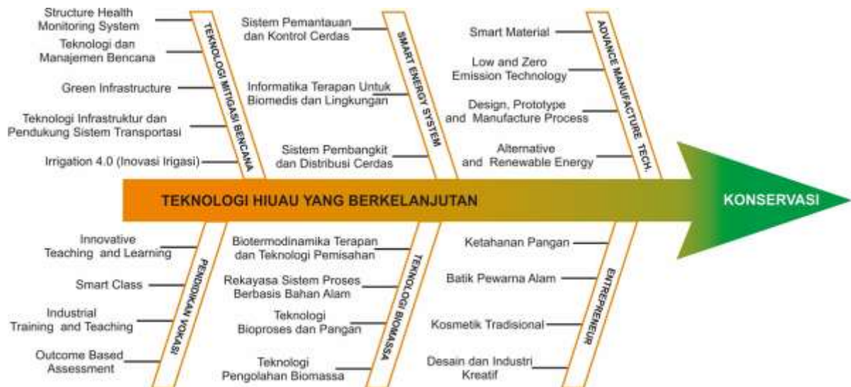
Gambar. Road Maps Penelitian dan Pengabdian kepada Masyarakat Fakultas Teknik UNNES

Dalam bab ini disampaikan hal-hal umum yang perlu ditekankan dari panduan penelitian dari PPM FT Unnes, dalam penyusunan proposal, laporan penelitian, maupun publikasi terkait. Tahun 2010, Unnes mendeklarasikan sebagai Universitas konservasi. Dengan deklarasi ini Unnes mempunyai komitmen untuk menjaga lingkungan dengan berbagai program diantaranya penyelamatan keaneragaman hayati yang sangat berfungsi secara ekologis dan produktif yang sangat penting untuk menjaga keseimbangan alam yang berpengaruh terhadap kehidupan manusia. Sedangkan program konservasi Sumber daya alam Unnes berkomitmen untuk memperhatikan penghijauan dan berkomitmen mengijaukan kembali Indonesia (regreening Indonesia) diawali mewujudkan dengan lima pilar (Green campus, Biodiversitas, pengolahan sampah, solar cell, dan paperless policy). Sedangkan untuk menyikapi terjadinya degradasi karakter bangsa mempunyai komitmen untuk melakukan konservasi budaya. Penelitian dan pengabdian hendaknya didasarkan pada Road Maps Penelitian dan Pengabdian kepada Masyarakat Fakultas Teknik UNNES, sehingga tujuan akhir dari penelitian dan pengabdian kepada masyarakat sejalan dengan peran aktif yang diemban oleh LPPM dalam mendukung Universitas Negeri Semarang menuju universitas konservasi dengan teknologi hijau yang berkelanjutan.