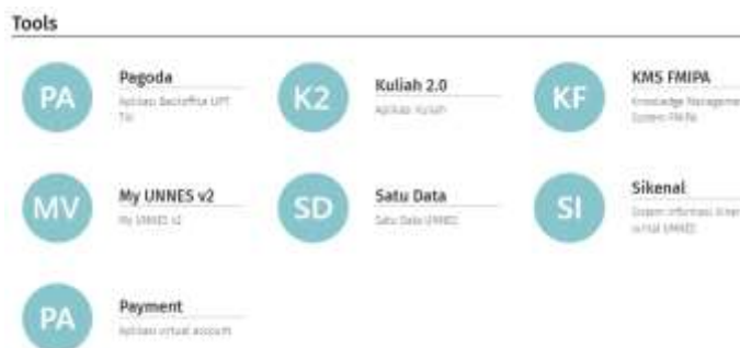
Gambar 1. 4 apps.unnes.ac.id tools