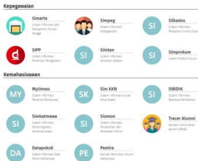
Gambar 1. 3 apps.unnes.ac.id bidang kepegawaian dan kemahasiswaan