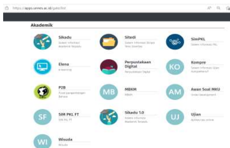
Gambar 1. 1 apps.unnes.ac.id bidang akademik