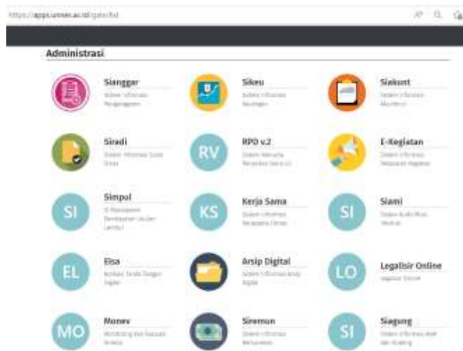
Gambar 1. 2 apps.unnes.ac.id bidang administrasi