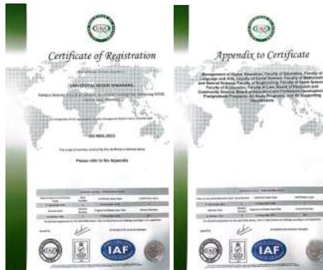
Gambar 1. 1 Sertifikat ISO 9001:2015 yang berlaku sampai 2024